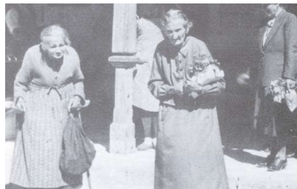
Die Option, Auszug aus der Heimat: Zwei Achzigjährige vor ihrer Abreise aus Laas

Zurück ins Jahr 1946: Immerhin war den Alliierten klar, dass sie dazu beitragen mussten, die Südtirol-Frage zu lösen oder das Land zumindest zu befrieden. Sie zwangen Österreich und Italien vor dem Hintergrund des aufziehenden kalten Krieges mehr oder weniger dazu, sich unter Zeitdruck auf einen Kompromiss zu einigen. Am 5. September 1946 unterzeichneten Karl Gruber und Alcide Degasperi den Pariser Vertrag.