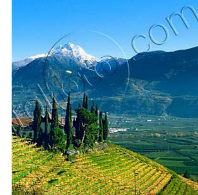
Die Autonomie: reiche Frucht für Südtirol

Mit dem Beitritt Österreichs zur EU im Jahre 1995 sind beide Vertragsparteien als EU-Mitgliedsstaaten näher zusammengedrückt. Der Pariser Vertrag ist dadurch jedoch in keinster Weise überflüssig geworden. Das EU-Recht beinhaltet beim derzeitigen Stand nämlich keinen spezifischen Minderheitenschutz. Auch die Schutzfunktion Österreichs bleibt unvermindert aufrecht. Der im Oktober 2004 in Rom unterzeichnete Vertrag für eine Verfassung für Europa wird mit seinem Inkrafttreten neue Bestimmungen zum Minderheitenschutz bringen. Damit wird EU-weit ein Mindeststandard an Minderheitenschutz verbindlich festgeschrieben. Dieser bleibt inhaltlich allerdings weit hinter dem in Südtirol erreichten Schutzstandard zurück. Allein schon aus diesem Grund werden Pariser Vertrag und Paket auch nach dem Inkraft-Treten