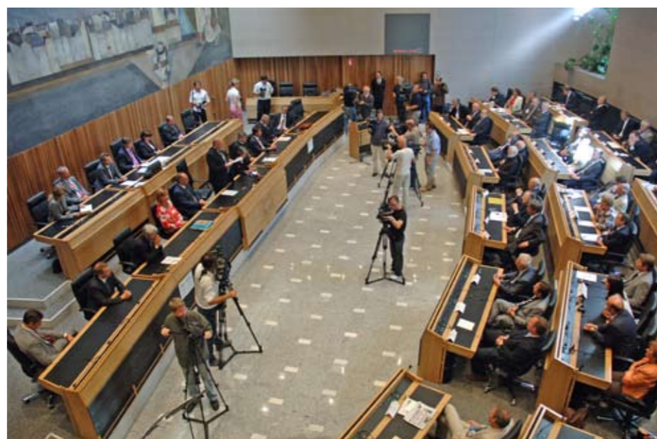
Festakt im Südtiroler Landtag am 5. September 2006

reg-Programmen setzte unser Land Zeichen. 1995 war Südtirol unter den ersten Ländern, die – gemein-