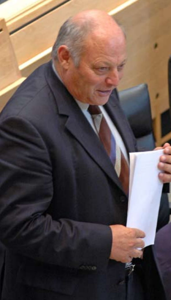
Landeshauptmann Luis Durnwalder

Je näher in den letzten Wochen der 60. Jahrestag des Gruber-Degasperi-Abkommens gerückt ist, desto heftiger wurde über dieses Schriftstück diskutiert. Es stellt zweifellos den Ausgangspunkt der heutigen Südtirol-Autonomie dar, doch ging es in der Debatte weniger um den Pariser Vertrag, als vielmehr um jene beiden Personen, die das Abkommen unterzeichnet haben. Wieder einmal wurde die Rolle Alcide Degasperis als „Betrüger“ der Südtiroler Minderheit zitiert und Karl Gruber als unerfahrener Diplomat an den Pranger gestellt, der die Selbstbestimmung auf dem Gewissen habe. Um ehrlich zu sein, wäre es mir lieber gewesen, man hätte eine fruchtbringende Diskussion über die Inhalte