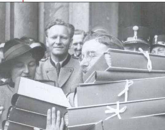
Bundeskanzler Leopold Figl werden am 22. April 1946 in Innsbruck 155.000 Südtiroler Unterschriften für die Selbstbestimmung übergeben.

sprachige Bevölkerung ist keinerlei besonderer Schutz vorgesehen.