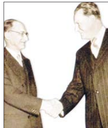
Alcide De Gasperi und Karl Gruber am 5. September 1946 in Paris

Das Umfeld für das Abkommen war für die österreichische Delegation schwierig. Österreich war von den vier Siegermächten besetzt und kein souveräner Staat, zudem war es deutschsprachig und bis zum Ende Teil des „Hitler-Reiches“